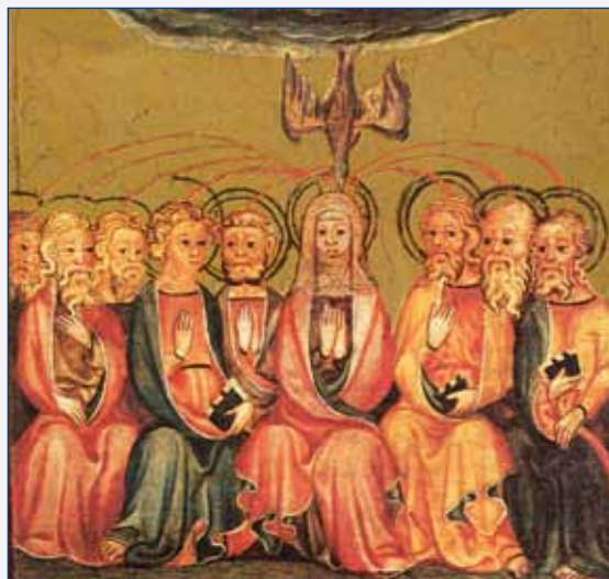
Das Pfingstwunder - Kölner Meister um 1350