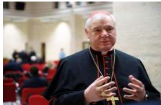
Kardinal Gerhard Müller